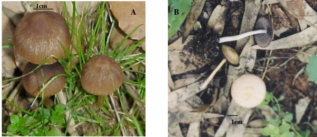
Figure 1. Carpophores de Panaeolus campanulatus (A) et de Panaeolus foeniseccii (B).