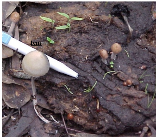
Figure 2. Carpophore de Panaeolus sphinctrinus .

étroitement adnées, peu serrées, brun grisâtre pâle puis brunâtre pâle et enfin brun noirâtre foncé, à arêtes blanches. Le stipe ( 5 \times 0,2 cm) est creux, et plus ou moins farci, poudré, parfois avec de fines gouttelettes vers le sommet au début, brun rosé pâle, brun rougeâtre en bas. La chair est brun rougeâtre pâle. La sporée est noire et l'acide sulfurique n'a aucun effet sur elle. Les spores ( 8-10 \times 7-8 \mu\text{m} ) sont elliptiques à largement elliptiques, à pore très net.